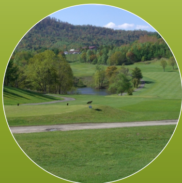
グレート旭川 G C