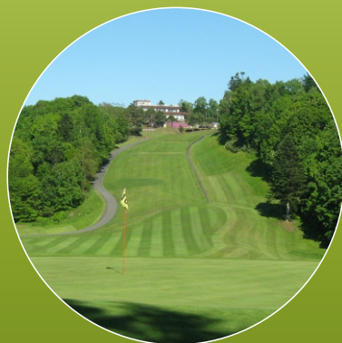
旭川たかす G C