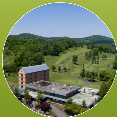
セント旭川 G C